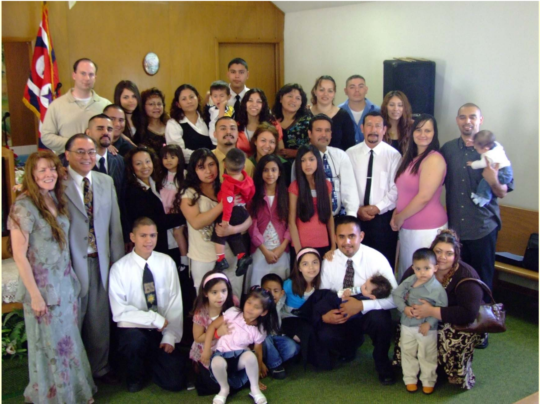
Luz del Mundo, Des Moines, Iowa