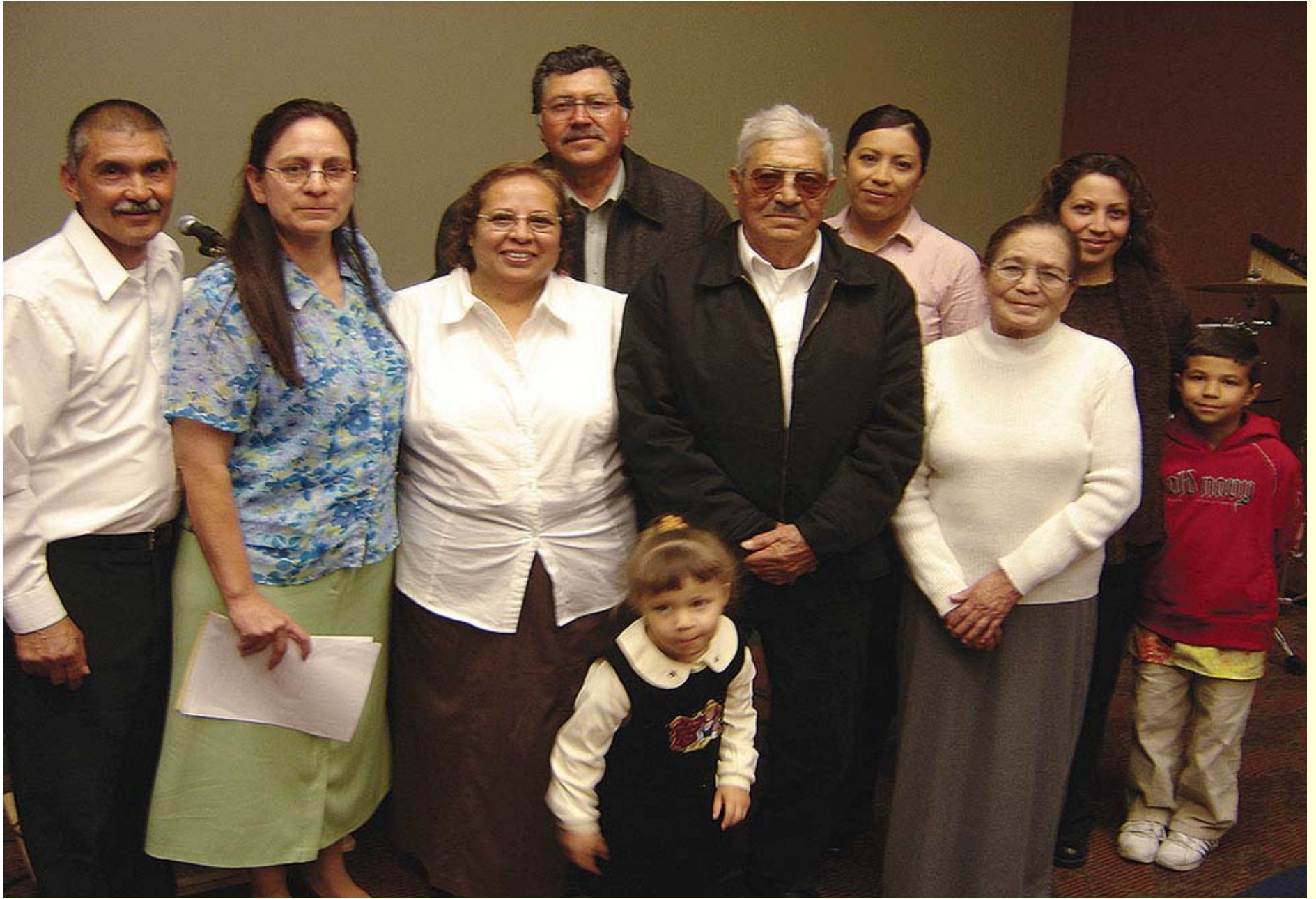
St. George, Utah S