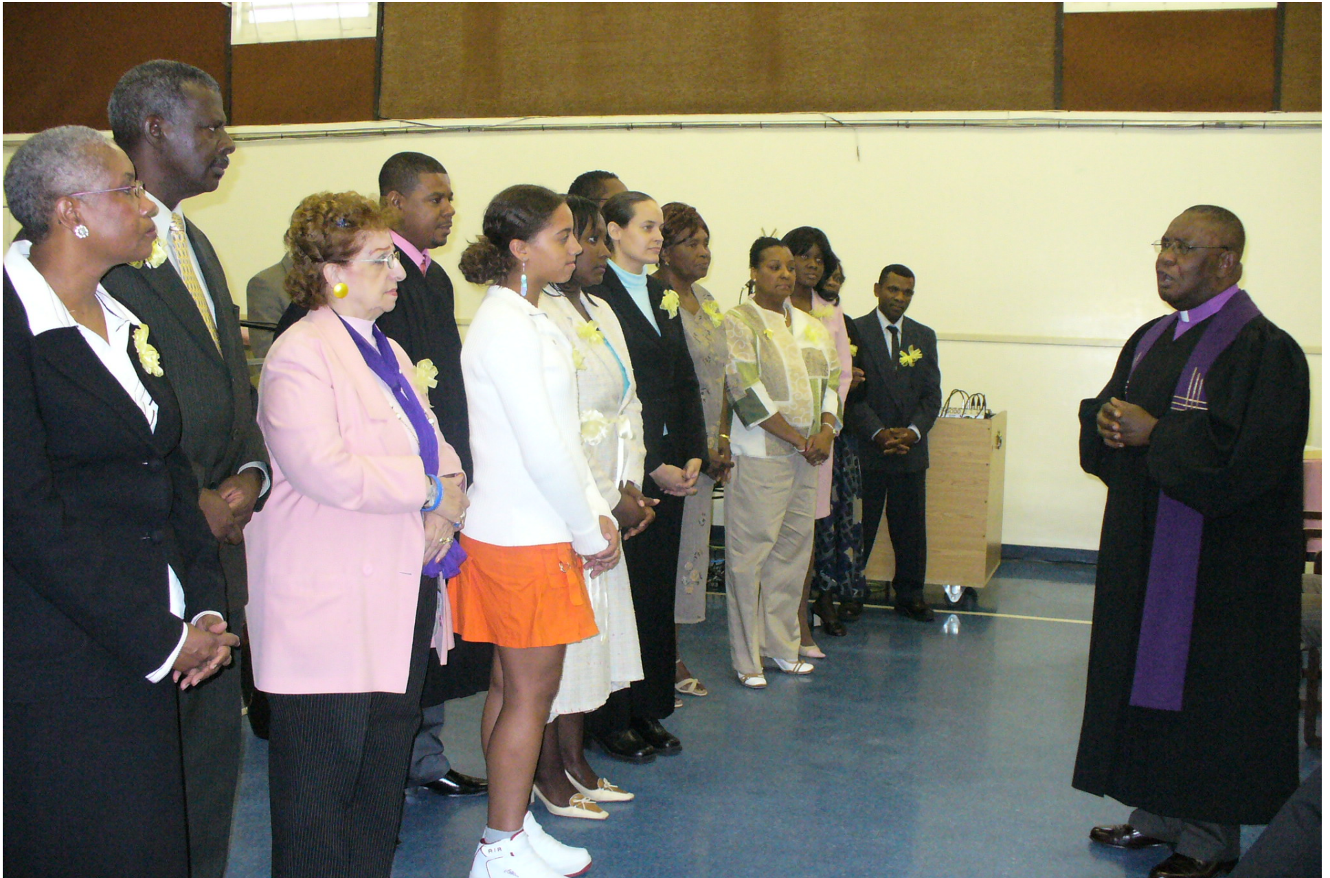
St. Catherines, Ontario, Canadá